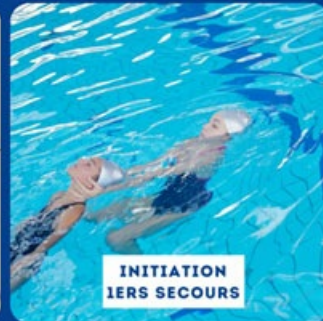
INITIATION 1ERS SECOURS