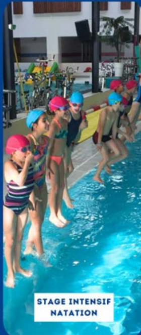
STAGE INTENSIF NATATION