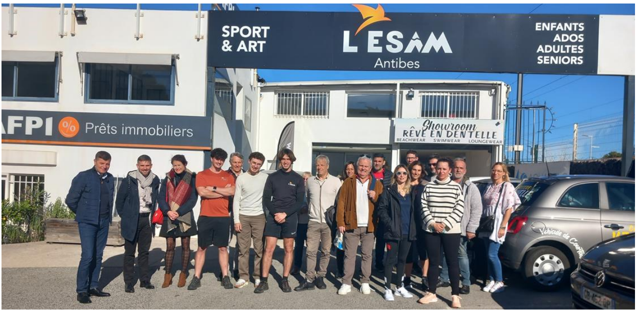
... Suivi les 170 chefs d'entreprise en phase post création sur le littoral...