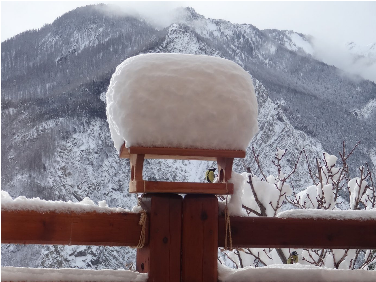
Mésange charbonnière à la mangeoire

L'hiver, le froid augmente les dépenses énergétiques des oiseaux et entraîne aussi une raréfaction des ressources alimentaires naturelles. C'est pourquoi en disposant une mangeoire dans son jardin ou sur son balcon, il est possible d'aider les oiseaux à traverser la période froide !