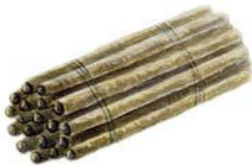
Nichoir à osmies

Même un tout petit espace suffit pour accueillir la biodiversité chez soi ! Par exemple, il est possible de planter des plantes aromatiques, comme le thym, le serpolet ou encore la sauge, dans des jardinières. Très attractives pour les insectes butineurs (comme les abeilles et les papillons), ces plantes sont également utilisables en cuisine ! Préférez une jardinière en bois ou en terre cuite, afin de favoriser l'évacuation de l'eau, et disposez au fond une couche de 1 ou 2 cm de graviers, petits galets ou de billes d'argiles. Pensez aussi à la plaquer contre un mur : la chaleur emmagasinée dans la journée sera ainsi restituée durant la nuit dans la terre. Pensez aussi aux plantes grimpantes, comme le lierre, la clématite, le chèvrefeuille ou la vigne-vierge, qui constituent un abri naturel pour les oiseaux et les insectes.