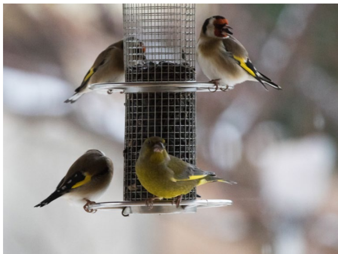
Oiseaux à la mangeoire - Michel Davin - LPO PACA