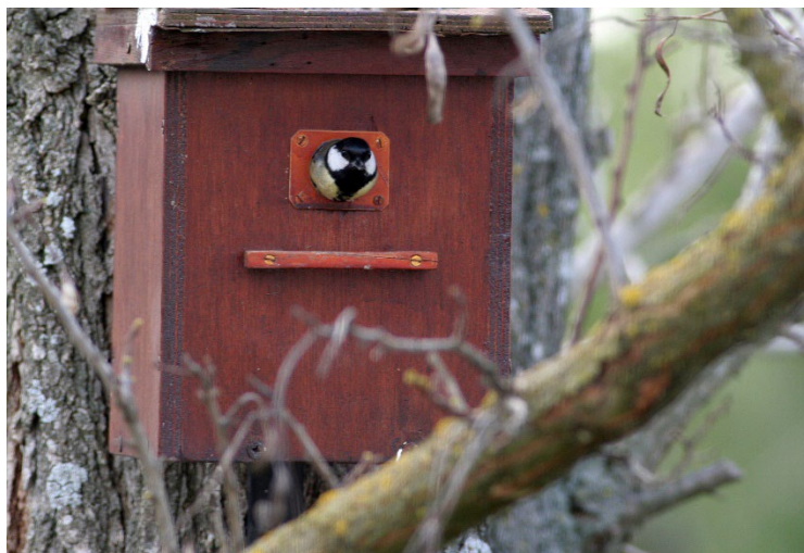
Mésange charbonnière dans un nichoir - Robert Monleau - LPO PACA