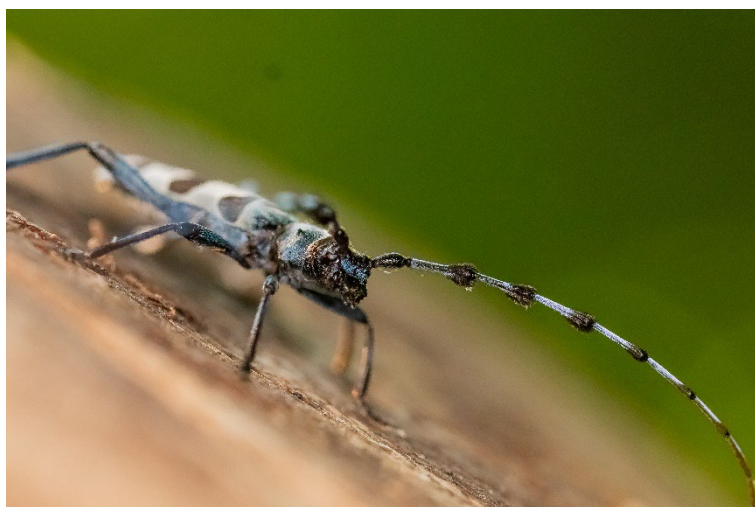
Rosalie des Alpes –Hugo Oms – LPO PACA