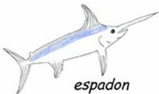
espadon pêche réglementée