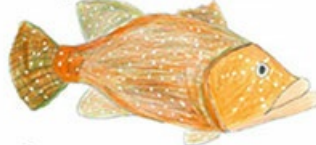
mérrou brun pêche interdite