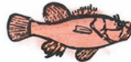
rascasse 22 cm