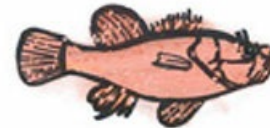
rascasse 22 cm