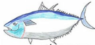
thon rouge pêche réglementée