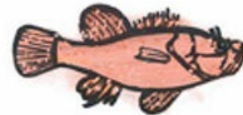
rascasse 22 cm