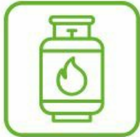
BOUTEILLES DE GAZ