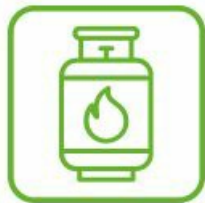
BOUTEILLES DE GAZ