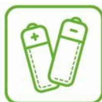
PILES, LES BATTERIES ET ACCUMULATEURS

Information avec l'association suivante : Liens vers le site Accueil - La Consigne de Provence ↗