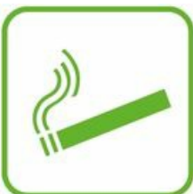
PRODUITS DE TABAC

Points de collecte et information avec l'éco-organisme suivant : Lien vers le site Cyclevia