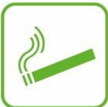
PRODUITS DE TABAC

Points de collecte et information avec l'éco-organisme suivant : Lien vers le site Cyclevia