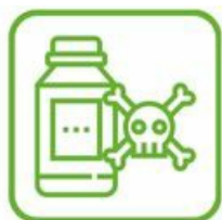
DÉCHETS DIFFUS SPÉCIFIQUES (DDS)

Point de collecte et information avec l'éco-organisme suivant : Lien vers le site Soren ↗