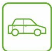
VÉHICULES HORS D'USAGE

Point de collecte et information avec l'éco-organisme suivant : Lien vers le site EcoDDS ↗