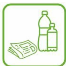
EMBALLAGES ET PAPIERS

Les filières à responsabilité élargie des producteurs (REP) sont des dispositifs particuliers d'organisation de la prévention et de la gestion de déchets qui concernent certains types de produits. C'est le concept du pollueur payeur.