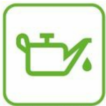
HUILES ALIMENTAIRES ET MOTEURS

Points de collecte et information avec l'éco-organisme suivant : Lien vers le site Ecomaison