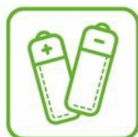
PILES, LES BATTERIES ET ACCUMULATEURS

Information avec l'association suivante : Liens vers le site Accueil - La Consigne de Provence ↗