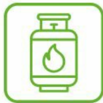
BOUTEILLES DE GAZ