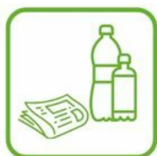
EMBALLAGES ET PAPIERS

L'État a créé 25 filières REP, regroupant de grandes familles de produits. Les fabricants s'y retrouvent pour former des sociétés appelées éco-organismes. Ceux-ci sont agréés par l'État pour 6 ans maximum et s'engagent à respecter un cahier des charges comprenant des objectifs de collecte et de recyclage.