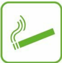
PRODUITS DE TABAC

Points de collecte et information avec l'éco-organisme suivant : Lien vers le site Cyclevia