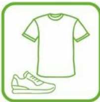
TEXTILES, CHAUSSURES, LINGE DE MAISON (TLC)

Points de collecte et information avec l'éco-organisme suivant : Lien vers le site Ecosystem