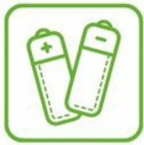
PILES, LES BATTERIES ET ACCUMULATEURS