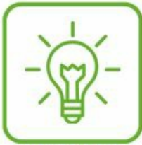
AMPOULES ET TUBES NÉON